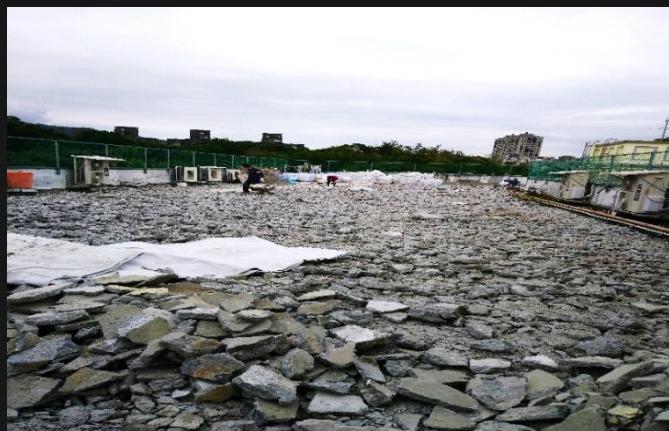
內湖校區屋頂防水工程