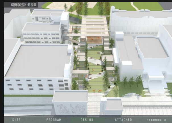
木柵校區新宿舍運動計畫