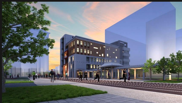
內湖校區劇藝教學大樓新建工程