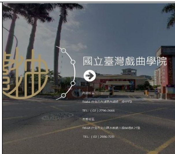
圖 2 校園 360 度環景導覽入口