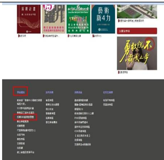
圖 1 校首頁底部「快速連結」