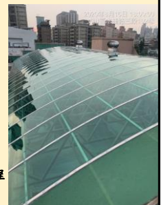
木柵校區學藝樓採光罩汰換工程