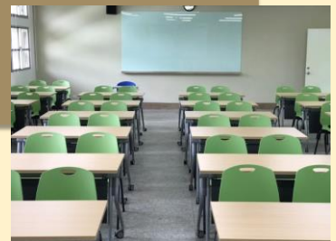
109學年度木柵校區學藝樓2F教室桌椅更新暨環境改善